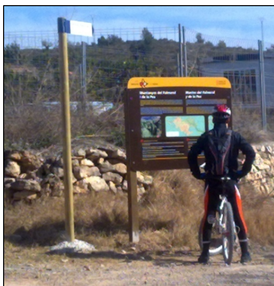
Cartelería colocada en MUP del Caudete y Palmeral