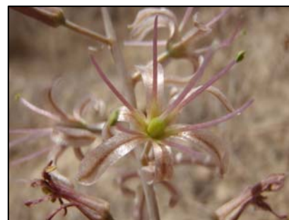
Foto. Urginea undulata Fuente: Oficina del Parque Natural del Turia

La población localizada se encuentra en la Lloma de Betxí, donde se están llevando a cabo trabajos arqueológicos que pueden poner en peligro su supervivencia, por lo que el objetivo del proyecto (iniciado en 2010) es la traslocación de los individuos que puedan encontrarse en riesgo a un nuevo emplazamiento. Las entidades que colaboran con la Oficina del Parque Natural del Turia en este proyecto de conservación son la Diputación de Valencia (Museo de Prehistoria de la CV), Brigada de Biodiversitat Nord (B2) y el CIEF.