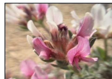
Foto. Anthyllis lagascana Fuente: Oficina del Parque Natural del Turia