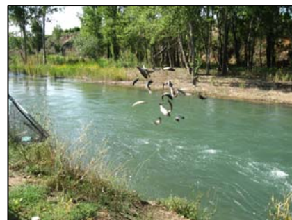
Foto. Suelta de ejemplares en el Turia

En 2011, el personal adscrito al Servicio de Biodiversidad realizó, en colaboración con la Oficina del Parque, una campaña de pesca eléctrica a fin de detectar la presencia de dichas especies a lo largo del tramo de río Turia adscrito al Parque.