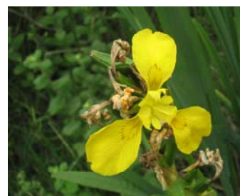
Foto. Iris pseudacorus Fuente: Oficina del Parque Natural del Turia