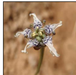
Foto. Garidella nigellastrum

La especie botánica Garidella nigellastrum está incluida en el Catálogo Valenciano de Especies de Flora Amenazadas dentro del Anexo 1a (en Peligro de Extinción). Cuenta con una población de unos 1.000 ejemplares en el TM de Pedralba, fuera del Parque Natural del Turia, encontrándose en franca regresión. Con el objetivo de introducir esta especie en el Parque Natural del Turia y crear una población en suelo protegido, dentro del M.U.P. Cueva de Chucheve y Palmeral, se inició este proyecto en 2010 en colaboración con el Ayuntamiento de Pedralba, la Sociedad de “Cazadores el Faisán” de Pedralba, el Servicio de Biodiversidad de la CITMA y el CIEF.