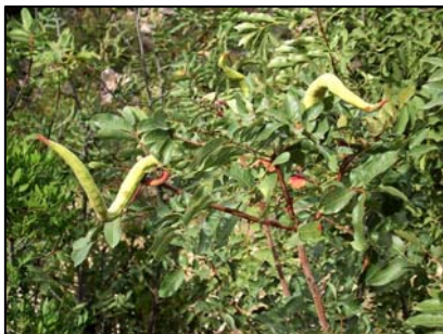
Foto. Pistacia terebinthus