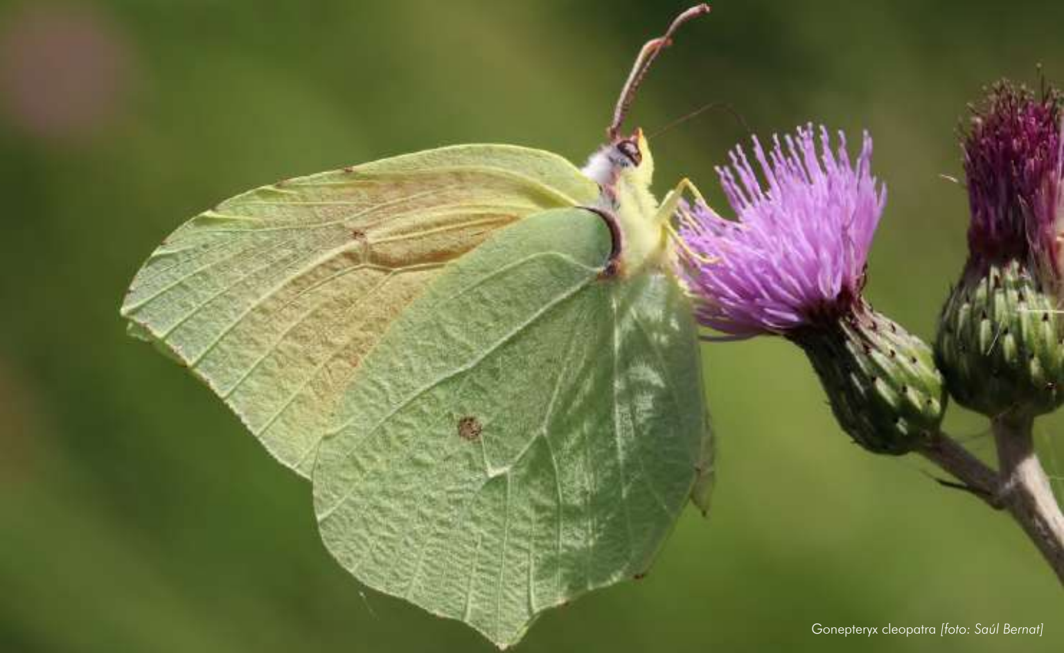
Gonepteryx cleopatra

El trabajo pretende dar a conocer la riqueza de mariposas diurnas del PN de la Serra de Mariola. Hasta el momento, se han citado 84 especies, lo que supone casi un 36% de la diversidad de mariposas diurnas de la Península Ibérica y un 55% del territorio valenciano. Aunque no es una guía exhaustiva de identificación de mariposas, esta publicación brinda, a través de fotografías en su entorno natural, una herramienta introductoria para el reconocimiento de las familias y algunas de sus especies. Con todo esto, se desea poner en valor la diversidad y la ecología de las mariposas diurnas del Parc Natural, así como fomentar el interés por la conservación de este grupo de insectos. Se presentan fotografías realizadas en el campo, donde las especies se agrupan por estaciones del año. Además, dentro de cada estación, se separan por la familia taxonómica a la cual pertenecen. Por lo tanto, se pueden encontrar las especies más comunes de observar por familia en cada estación. Hay que destacar que en invierno y en otoño, el número de especies de mariposas observables disminuye a consecuencia de la bajada de las temperaturas y las lluvias, sin embargo, es posible ver alguna de ellas en los días calurosos. Cada especie presenta su nombre científico, nombres comunes, la fenología con los meses más probables para la observación y un grado de rareza. Un trabajo excelente, completo y detallado a disposición de todo el mundo.