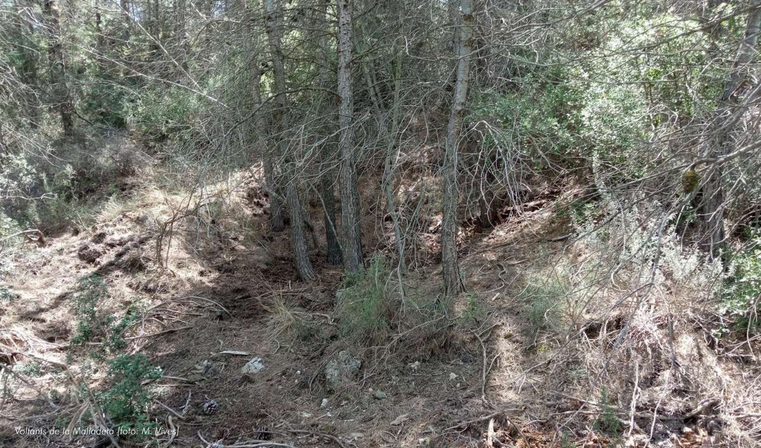
Volants de la Malladeta

transporte. Además del mantenimiento y la limpieza, el objetivo se dirige a una naturalización progresiva de la balsa, para que vaya poco a poco colonizándose por especies autóctonas vegetales y animales (invertebrados, anfibios...), de manera natural, para lo cual es imprescindible la tarea informativa y concienciadora, para evitar acciones que vuelven a truncar abruptamente la dinámica del hábitat.