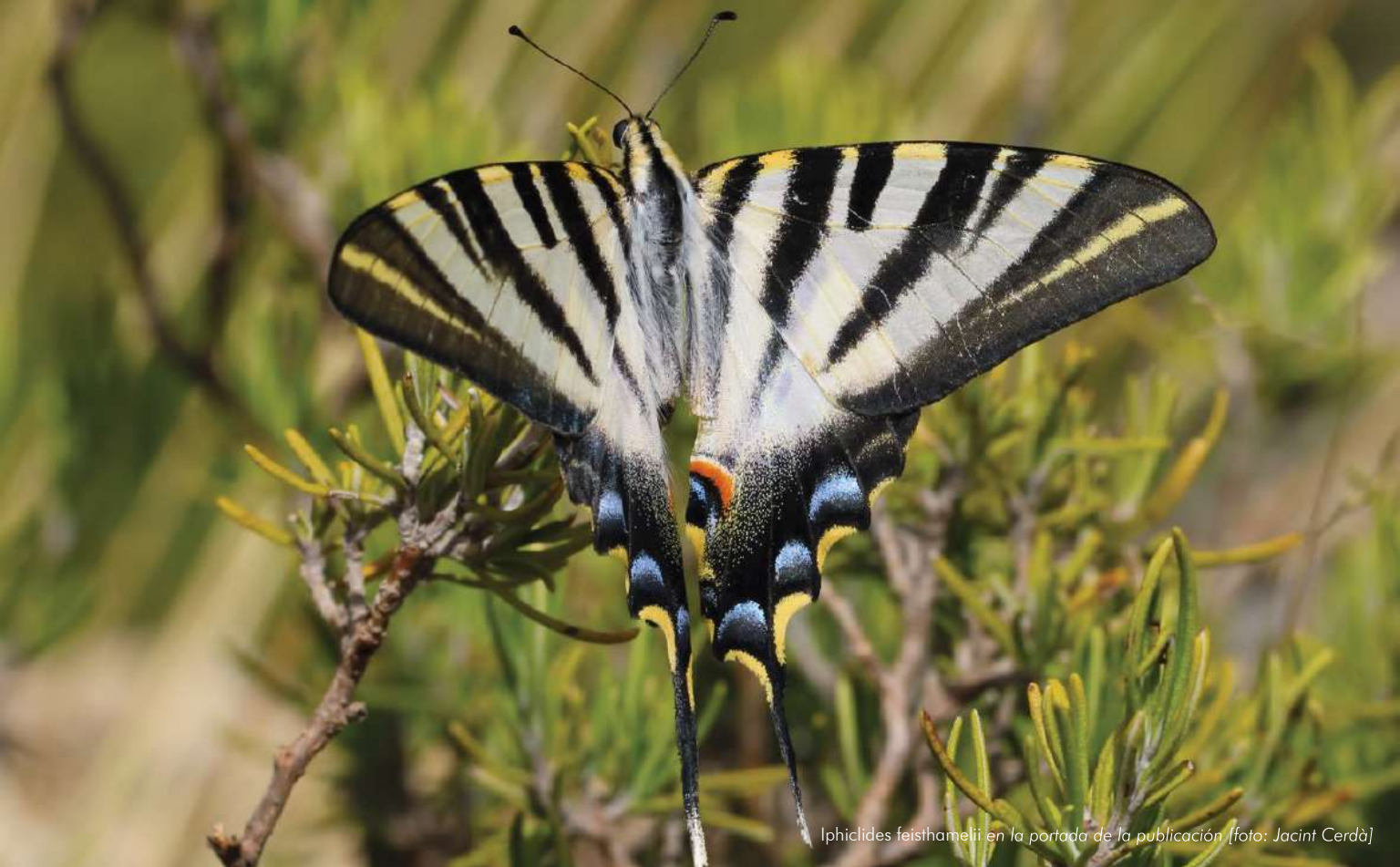
Iphiclides feisthamelii en la portada de la publicación