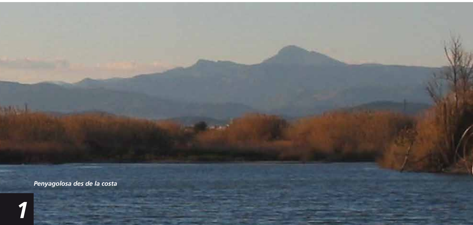
Penyagolosa des de la costa

Dins les hipòtesis lingüístiques destaquen les de Joan Coromines, Vicent Pitarch i el mateix Emilio Nieto. Coromines ens proposa, tot refutant la hipòtesi colosal, un zootopònim, una PINNA AQUILOSA: " Penyagolosa està més prop de les àguiles i Penàguila que del colós de Rodes". Obre una segona possibilitat relacionada amb la Pregunta " Penya (Pe)golosa . La cara sud i variants properes, la més