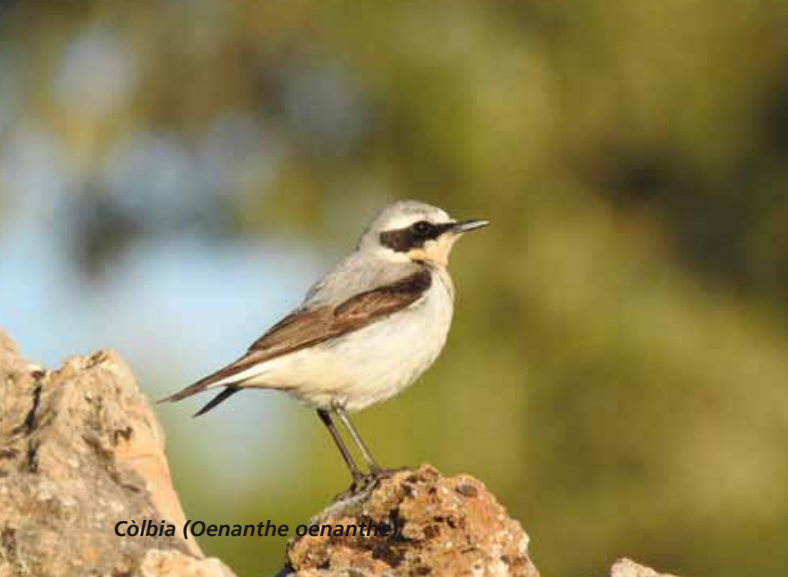
Còlbia ( Oenanthe oenanthe )