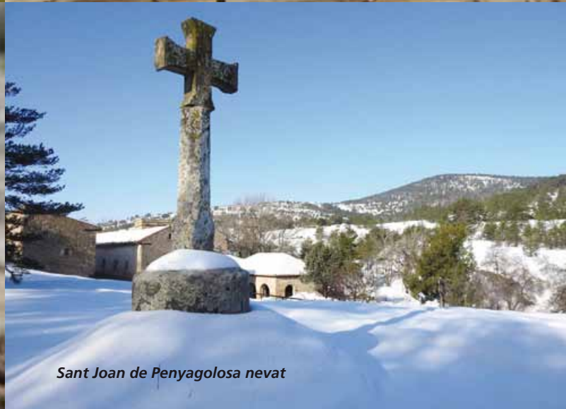
Sant Joan de Penyagolosa nevada