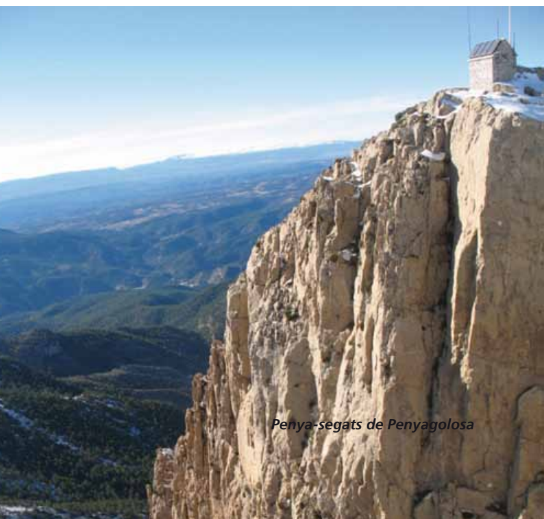
Penya-segats de Penyagolosa

1 Evidentment, cal aportar-hi més informació i afegir més raonaments etiològics i filològics. Els podeu trobar a J.Bernat "Penyagolosa, un orònim aigualós" dins Onomàstica Romànica. València 2017