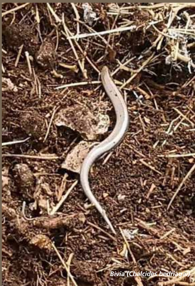
Bivia ( Chalcides bedriagai )