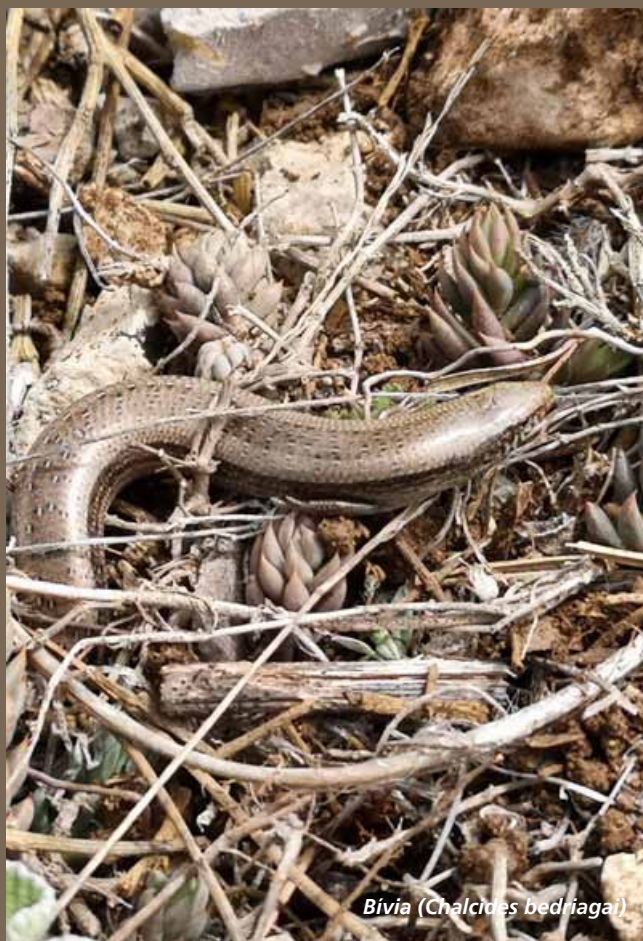
Bivia ( Chalcides bedriagai )