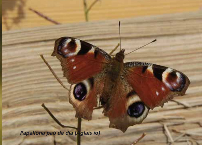
Papallona paó de dia ( Aglais io )