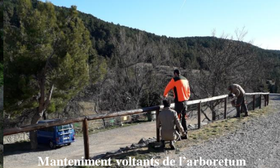
Manteniment voltants de l'arboretum