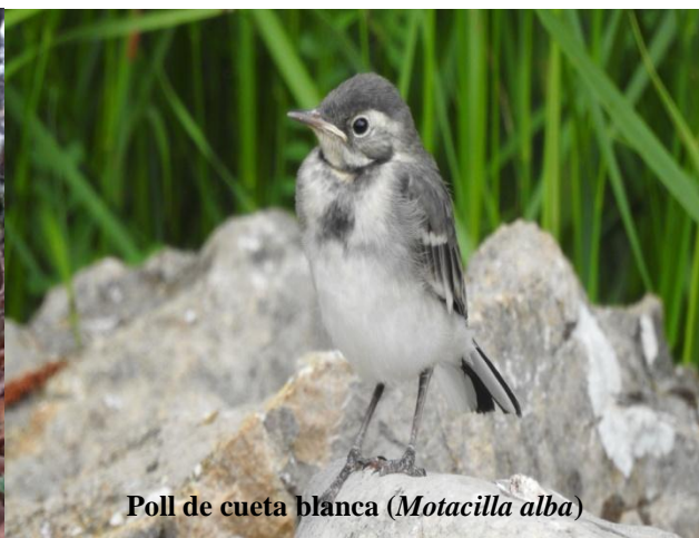
Poll de cueta blanca ( Motacilla alba )