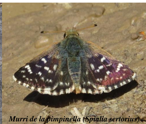
Murri de la pimpinella ( Spialia sertorius )