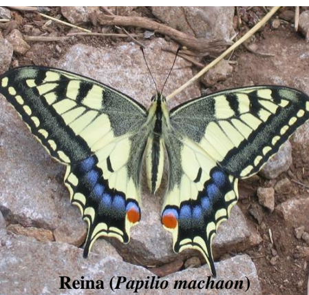
Reina ( Papilio machaon )

Des de les grans i vistoses papallones reines ( Papilio machaon ) i la papallona zebra ( Iphiclides podalirius ) amb curioses “cues” i tons groguencs, blancs, negres, blaus i rojos que recorren el jardí amb vol poderós i ràpid, a les moltes espècies de diminuts licènids (gèneres Polyommatus , Aricia , Cyaniris , Celastrina , Cupido , etc) que centellegen blaus entre l'herba o els mimètics i primitius hespèrids ( Carcharodus , Pyrgus , Spialia i altres) que passen desapercebuts amb els seus tons marrons i grisos, podem observar en l'Arborètum tota una simfonia de colors, formes i grandàries d'aquestes xicotetes fades del bosc.