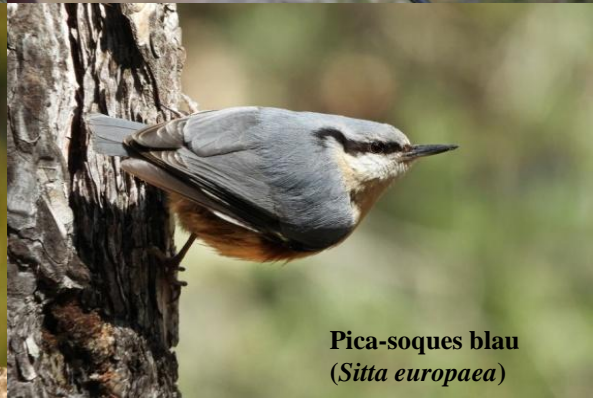
Pica-soques blau ( Sitta europaea )