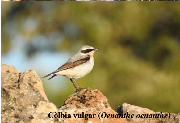
Còlbia vulgar ( Oenanthe oenanthe )