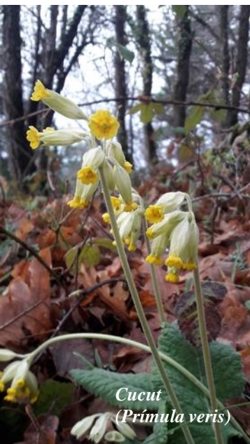
Cucut ( Primula veris )

17 de juny: El net cel de Penyagolosa mostra una especial combinació: una esplendorosa lluna plena i a la seua dreta Júpiter amb quatre de les seues llunes visibles amb prismàtics.