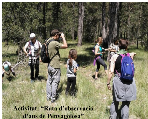
Activitat: "Ruta d'observació d'aus de Penyagolosa"

El cap de setmana del 22 i 23 de juny, gaudirem de "IV acampada en família" amb el que es va reivindicar el caràcter excursionista i muntanyenc dels paisatges de Penyagolosa, en el que nombrosos grups excursionistes acudien a instal·lar els seus campaments, any rere any com si d'un ritual es tractara, per a compartir les seues vivències sota el recer del gran Gegant de pedra. Al llarg del cap de setmana, es van fer diverses excursions, activitats i jocs diürns i nocturns a l'aire lliure.