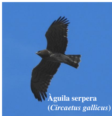
Àguila serpera ( Circaetus gallicus )