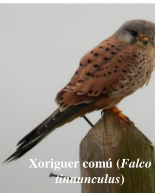
Xoriguer comú ( Falco tinnunculus )