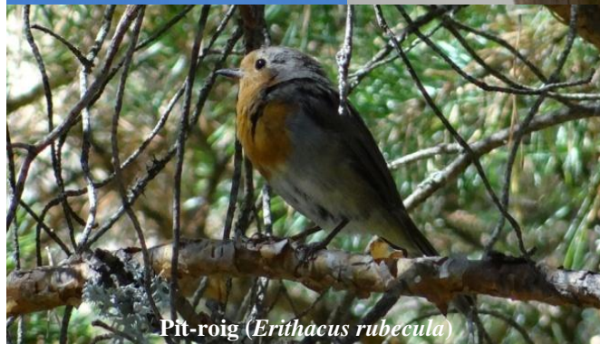
Pit-roig ( Erithacus rubecula )