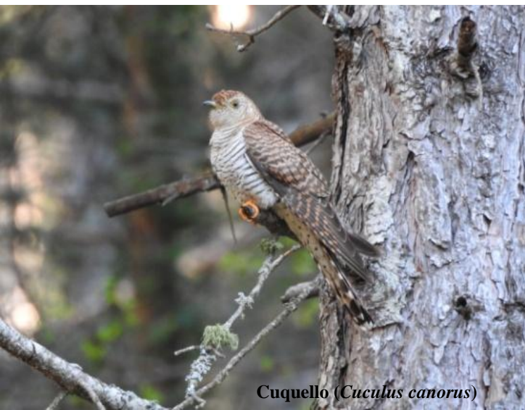
Cuquello ( Cuculus canorus )

29 d'abril: S'observa pas migratori cap al nord de 15 pilots ( Pernis apivorus ). Aquest curiós rapinyaire que s'alimenta sobretot de vespes i borinots està present també durant l'època reproductora al Parc Natural.