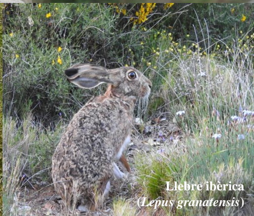
Llebre ibèrica ( Lepus granatensis )