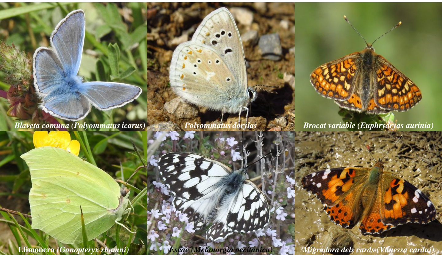
Blaveta comuna (Polyommatus icarus)

Una comunitat rica de lepidòpters necessita una vegetació variada, particularment en herbàcies i xicotetes llenyoses (caméfits), que continga les diferents plantes nutrícies de les larves, i que d'altra banda arribe a completar el seu cicle vital, és a dir que se li permeta almenys aconseguir i mantindre la floració per a oferir el manteniment als adults. És per aquest motiu, per a conservar la biodiversitat florística i entomològica, que el Arborètum no es sega fins que s'agosta l'herba.