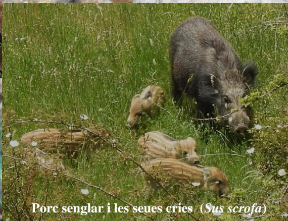
Porc senglar i les seues cries ( Sus scrofa )