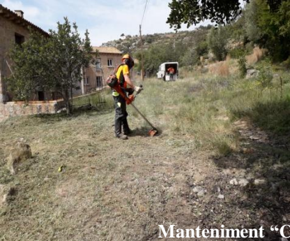
Manteniment "Camí dels Peregrins"