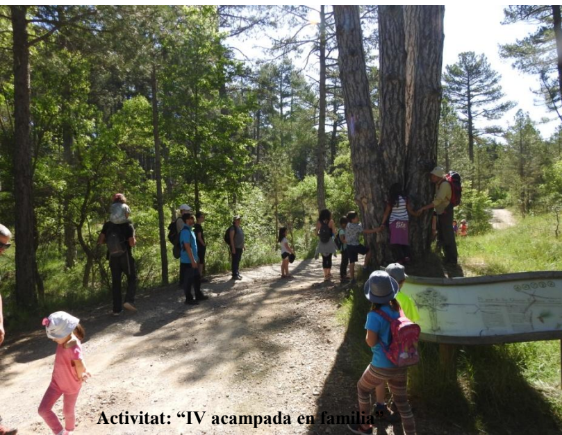
Activitat: "IV acampada en família"