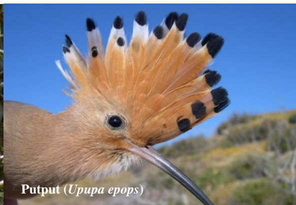
Putput ( Upupa epops )