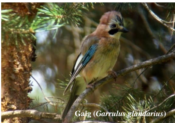
Gaig ( Garrulus glandarius )

Si decidim recórrer zones més obertes amb matolls, parats al damunt podem localitzar el bitxac comú ( Saxicola rubicola ), la cua-roja fumada ( Phoenicurus ochuros ), la còlbia vulgar ( Oenanthe oenanthe ) i la puput ( Upupa epops ); en canvi, picotejant per terra podem detectar la griva ( Turdus viscivorus ), la cogullada vulgar ( Galerida cristata ) i l'alosa ( Alauda arvensis ).