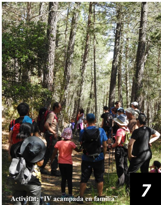
Activitat: "IV acampada en família"