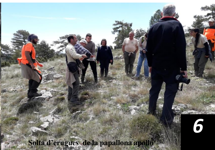
Solta d'erugues de la papallona apollo