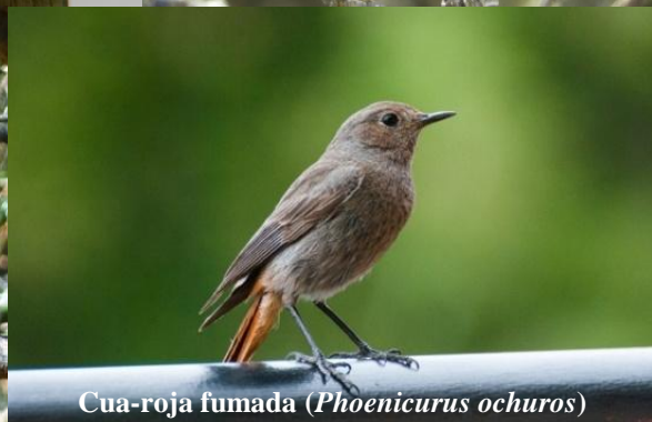
Cua-roja fumada ( Phoenicurus ochuros )

D'altra banda, si fem una passejada per les zones ajardinades amb diferents tipus d'arbres, com l'arborètum de Josep Vigo i Bonada, podrem observar i escoltar el gafarró ( Serinus serinus ), el verderol ( Chloris chloris ), el pinsà ( Fringilla coelebs ), el pit-roig ( Erithacus rubecula ), la cadenera ( Carduelis carduelis ), la merla ( Turdus merula ) i la cueta blanca ( Motacilla alba ).