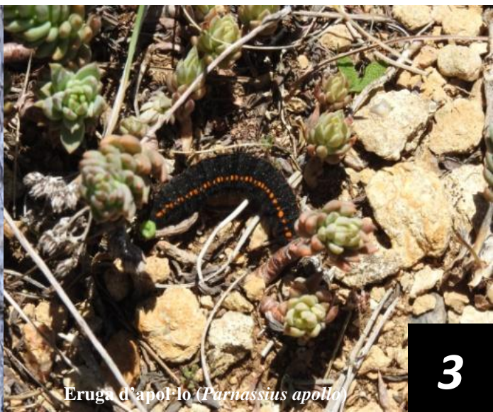
Eruga d'apol·lo ( Parnassius apollo )