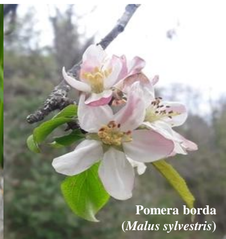
Pomera borda ( Malus sylvestris )