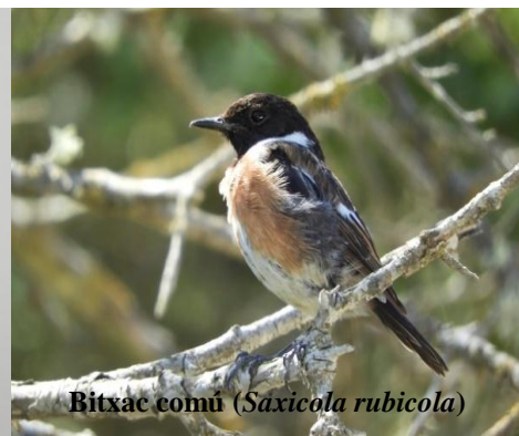
Bitxac comú ( Saxicola rubicola )