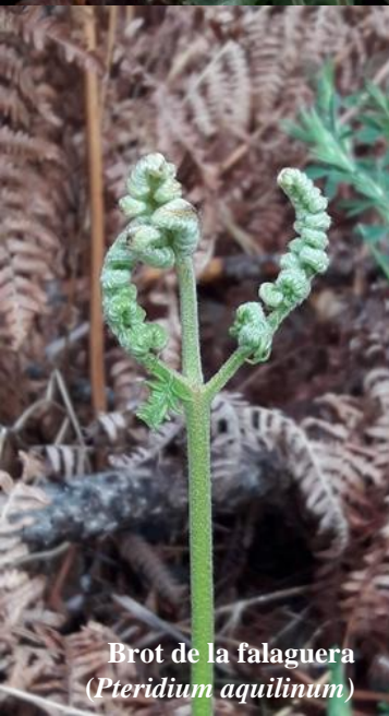
Brot de la falaguera ( Pteridium aquilinum )