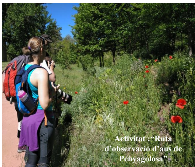
Activitat: "Ruta d'observació d'aus de Penyagolosa"