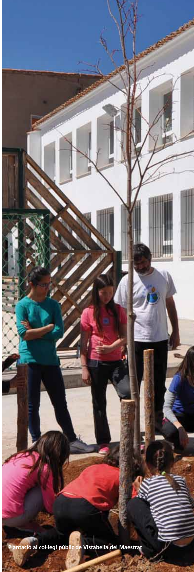
Plantació al col·legi públic de Vistabella del Maestrat

Així, aquest 31 de gener, celebrarem el dia de l'arbre visitant un dels arbres centenaris del parc, arbres tan longeus com fràgils i sensibles a la deterioració del seu hàbitat que fa que mereixi tota la nostra atenció i respecte.