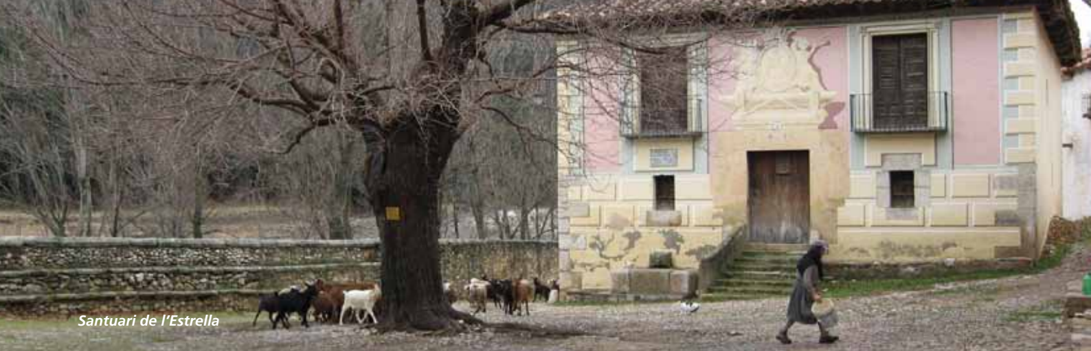
Santuari de l'Estrella