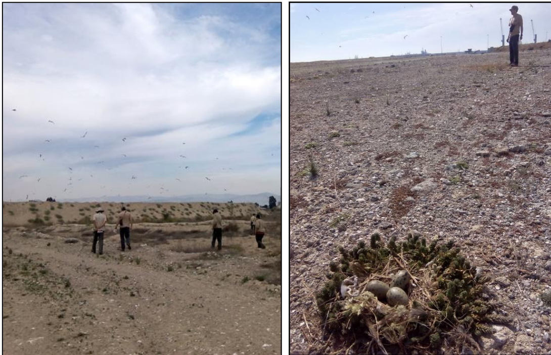
Figuras 1 y 2. Entrada al Puerto de Castellón para el recuento de nidos (5/5/2016).

Excluyendo los nidos vacíos, el tamaño medio de puesta fue 2,75 (n = 3.335). Por otro lado, a partir del marcaje (con anillas metálicas y anillas de PVC) y recaptura de pollos llevados a cabo entre los días 13 y 14 de junio, se obtuvo una estimación de la productividad de la colonia de 0,48 pollos/pareja, cifra algo menor a la obtenida la temporada anterior (0,52 pollos/pareja).