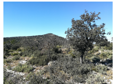
Las sequías extremas y periodos de temperaturas más altas en el verano producen secas de ejemplares o bosquetes de carrascas

puestas de algunas especies de aves como los páridos y a un menor éxito reproductor. Estos pollos saldrían del nido en peores condiciones físicas por falta de alimento y que llevaría a una menor supervivencia. Este hecho continuado lleva a una tendencia a la baja de las poblaciones de algunas especies como el carbonero garrapinos. Los estudios globales sobre Cambio Climático apuntan a una subida progresiva de las temperaturas, que necesariamente irá influyendo en la configuración natural del paisaje. Sobre el Carrascal de la Font Roja todavía no existen datos contrastados que constatan este cambio local, pero todo apunta que se irá sucediendo una variación adaptativa de las especies que configuran el ecosistema, y tenemos que ser conscientes que estamos a las puertas de este cambio.