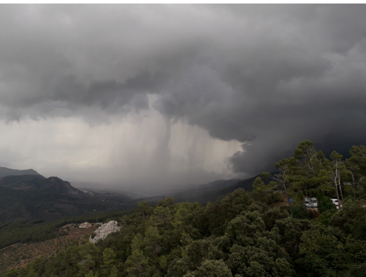
Tormenta de verano descargando sobre la ciudad de Alcoi y la zona Este del Parque Natural. Septiembre 2018

puestas de algunas especies de aves como los páridos y a un menor éxito reproductor. Estos pollos saldrían del nido en peores condiciones físicas por falta de alimento y que llevaría a una menor supervivencia. Este hecho continuado lleva a una tendencia a la baja de las poblaciones de algunas especies como el carbonero garrapinos. Los estudios globales sobre Cambio Climático apuntan a una subida progresiva de las temperaturas, que necesariamente irá influyendo en la configuración natural del paisaje. Sobre el Carrascal de la Font Roja todavía no existen datos contrastados que constatan este cambio local, pero todo apunta que se irá sucediendo una variación adaptativa de las especies que configuran el ecosistema, y tenemos que ser conscientes que estamos a las puertas de este cambio.