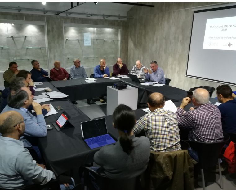
Reunió de la Consell de Protecció del Parque Natural de la Font Roja, celebrada en el Museo de la Biodiversidad (Ibi)

El 4 de diciembre de 2018 se celebra en el Museo de la Biodiversidad (Ibi) la segunda reunión ordinaria del Consell de Protecció del Parque Natural de la Font Roja. A la cita acuden 20 miembros en representación de diversas administraciones, entidades locales y colectivos vinculados a la gestión del Parque Natural. Entre los temas que se tratan destacamos: la presentación del Plan Anual de Gestión 2019, las actuaciones relativas al Plan de Prevención de Incendios Forestales, cuestiones relativas al proyecto del Censo de Ungulados Herbívoros, la creación de la Comisión Científica de los parques naturales de la Font Roja y la Serra de Mariola, la propuesta de revisión de los miembros del propio Consell y las actuaciones de la retirada de pinos de la masa forestal del carrascal. Se trata de un foro participativo de debate de gran interés para la gestión del este espacio protegido.