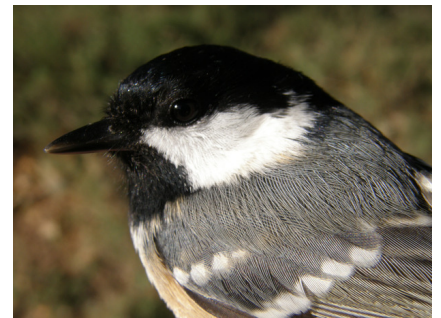
Primaveras más largas y más secas llevan a una tendencia a la baja de las poblaciones del carbonero garrapinos en el Parque Natural.