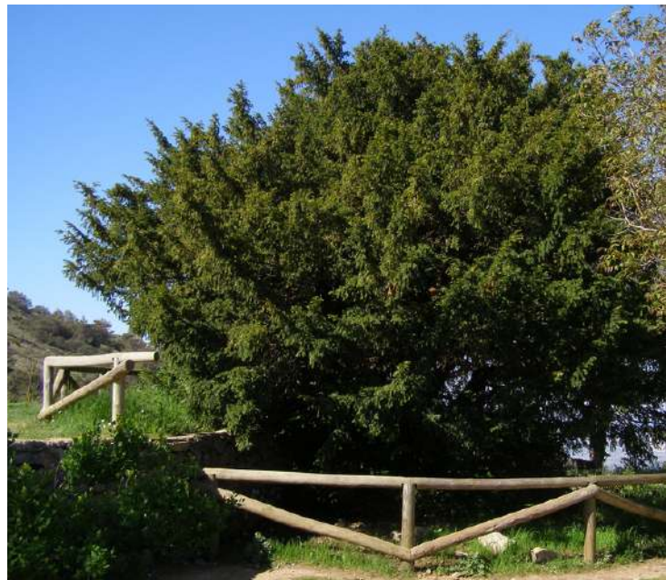
Imágenes superiores, detalle de las flores masculinas y el pseudofruto (arilo). Imagen inferior, ejemplar de tejo centenario junto a la era del mas de Tetuan.