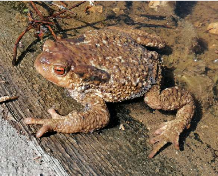
Ejemplar de sapo común ( Bufo spinosus ) saliendo de un bebedero.

El aumento del fotoperiodo (horas de luz diarias) y la subida de las temperaturas, junto con la llegada de las lluvias primaverales hacen aparecer a las diferentes especies de anfibios que salen de su letargo invernal. Con rapidez, y aprovechando al máximo la presencia del agua, desarrollan su periodo reproductor. Fuentes, charcas, abrevaderos y charcos temporales de diferentes dimensiones se llenan de puestas y, en días, de larvas. Sapos corredores, sapos parteros, sapos comunes o sapos moteados llenan cualquier punto de agua, dependiendo de sus necesidades reproductivas. Es destacable el hecho que en el Parque Natural existe una preocupación para mantener con agua los diferentes bebederos para favorecer, así, la reproducción y presencia de estas especies.