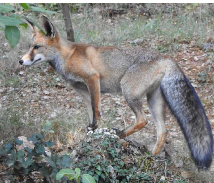
Ejemplar de zorro rojo ( Vulpes vulpes ) en las inmediaciones del Centro de Visitantes.

Desde hace unos meses deambula por los alrededores del Centro de Visitantes, un ejemplar juvenil o subadulto de zorro rojo. No es la primera vez que ejemplares juveniles de zorro rondan por la zona, acercándose a lugares donde hay presencia humana. Este comportamiento puede ser debido al hecho de que los ejemplares jóvenes descubren una fuente de alimento fácil al aproximarse a lugares en los cuales hay personas.