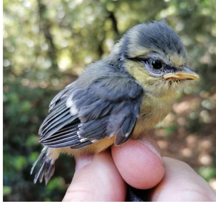
Pollito de herrerillo común ( Cyanistes caeruleus ) de 14 días de edad.

Actividad abierta al público para explicar el seguimiento de las poblaciones de aves forestales, celebrada el sábado día 12 de junio. En esta actividad se revisan 11 cajas-nido que se encuentran instaladas en el área de uso público del Santuario. De estas 11 cajas, 2 no han sido ocupadas, 2 han sido predadas por una garduña ( Martes foina ) y de las otras 7, 6 cajas están ocupadas por el herrerillo común ( Cyanistes caeruleus ) y 1 por carbonero común ( Parus major ). En las 6 cajas de herrerillo se anillan 32 pollitos entre 10 y 14 días de edad, y en la caja de carbonero se anillan 6 pollitos de 15 días de edad.