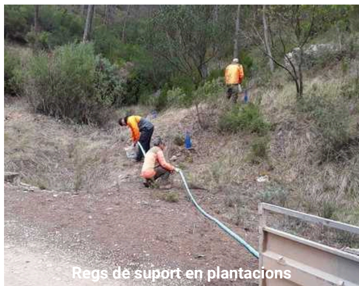
Regs de suport en plantacions