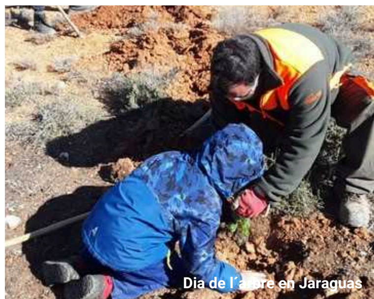
Dia de l'arbre en Jaraguas