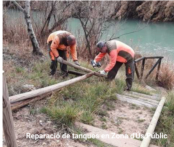
Reparació de tanques en Zona d'Ús Públic