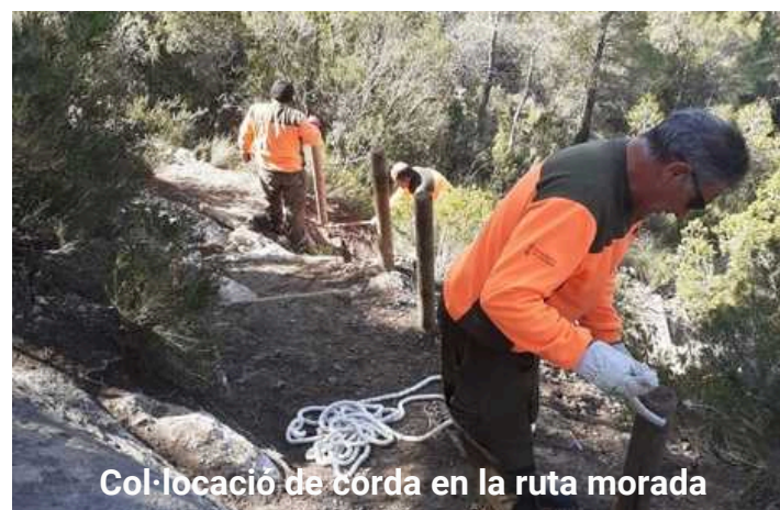
Col·locació de corda en la ruta morada