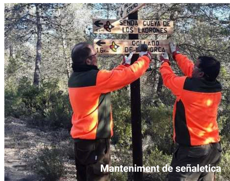
Manteniment de senyalètica