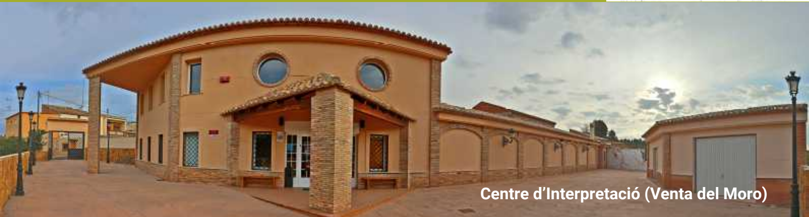
Centre d'Interpretació (Venta del Moro)

Butlletí quadrimestral Parc Natural Gorges del Cabriol