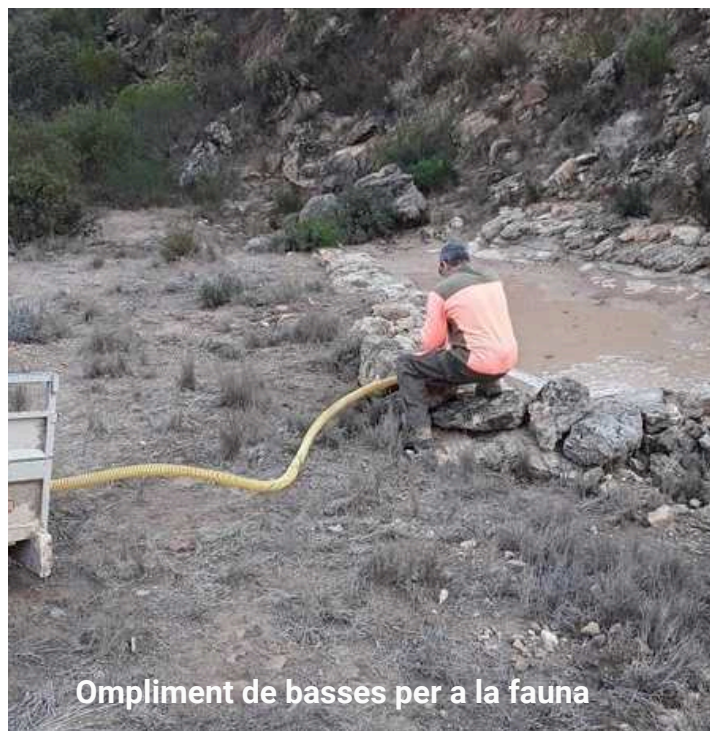
Ompliment de basses per a la fauna

S'ha actuat sobre la ruta morada del Parc pel fet que és una de les rutes que més fan els visitants del parc. Per a millorar la seguretat el visitant s'han col·locats tanques, escalons, etc