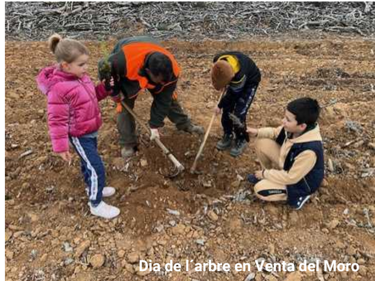
Dia de l'arbre en Venta del Moro