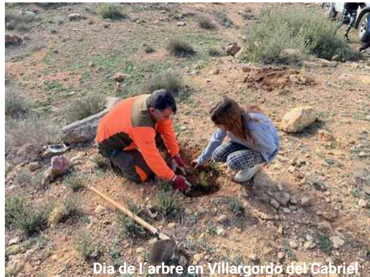
Dia de l'arbre en Villargordo del Cabriel