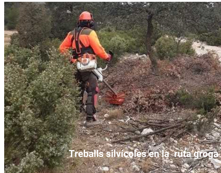
Treballs silvícoles en la ruta groga