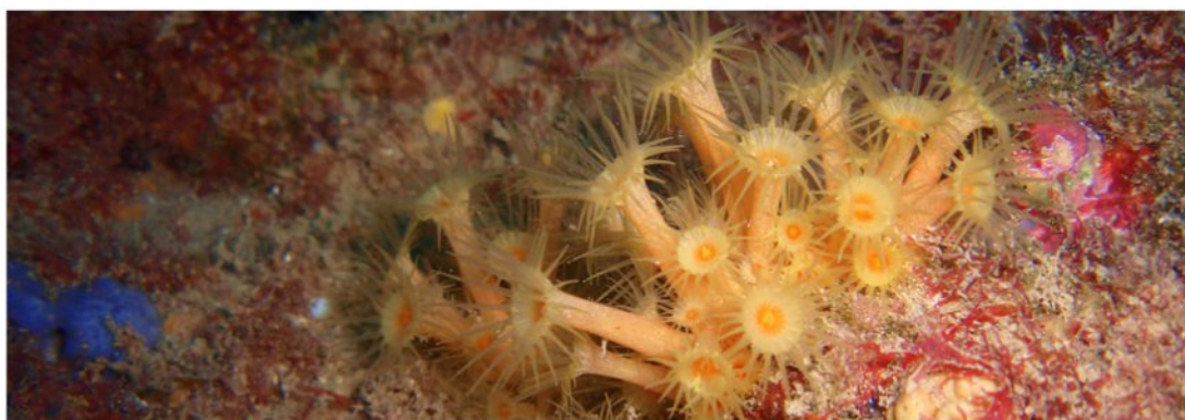
L.I.C. IFAC - PARC NATURAL DE LA SERRA GELADA