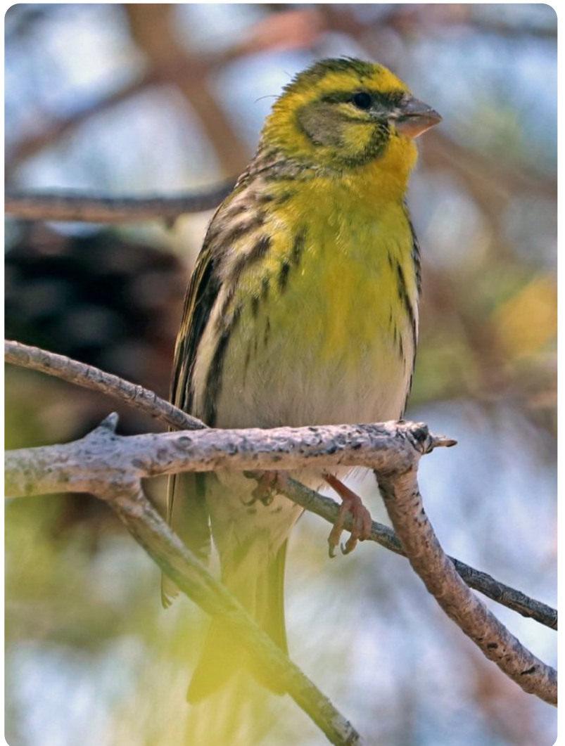
Foto: Serinus serinus , mascle

Es tracta d'un ocell resident en la península Ibèrica durant tot l'any, en el Parc Natural del Penyal d'Ilfac és sedentària i molt abundant.