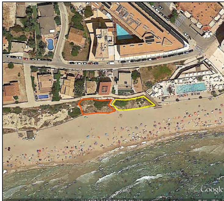
Figura 2. Detalle de las zonas de trabajo: Zona A (amarillo) y Zona B (rojo).

El trabajo se desarrolló en dos subparcelas, ocupando un área total de 452 m 2 . En la zona A, con poca pendiente, se procedió a la eliminación manual de ejemplares. En la zona B, los ejemplares de EEI se situaban en acantilados, por lo que debido al riesgo de caídas, se utilizaron técnicas de trabajos verticales.