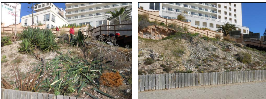
Figura 4. Zona A: Estado antes, izquierda (noviembre 2013) y después, derecha (febrero 2015).

A continuación se muestran unas imágenes comparativas donde se muestra el antes y el después de las actuaciones realizadas, así como el estado de algunas de los taxones introducidos.