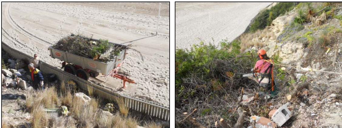
Figura 3. Contenedor con restos de EEI eliminadas. Uso de técnicas de trabajos verticales en la Zona B.

Cabe mencionar que también se procedió a la retirada de 0,5 m 3 de basura y escombros.