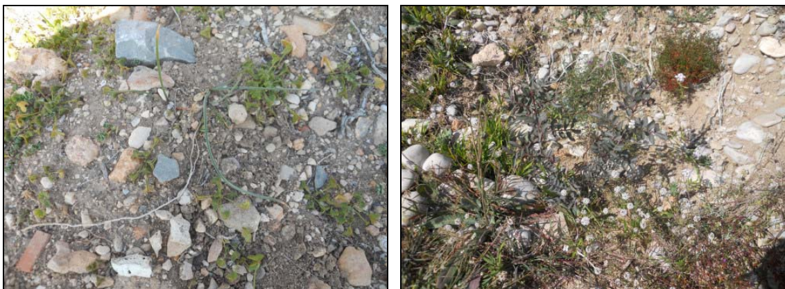
Figura 6. Ejemplares de Allium subvillosum (izquierda) y Pistacia lentiscus (derecha) supervivientes en Febrero 2015.