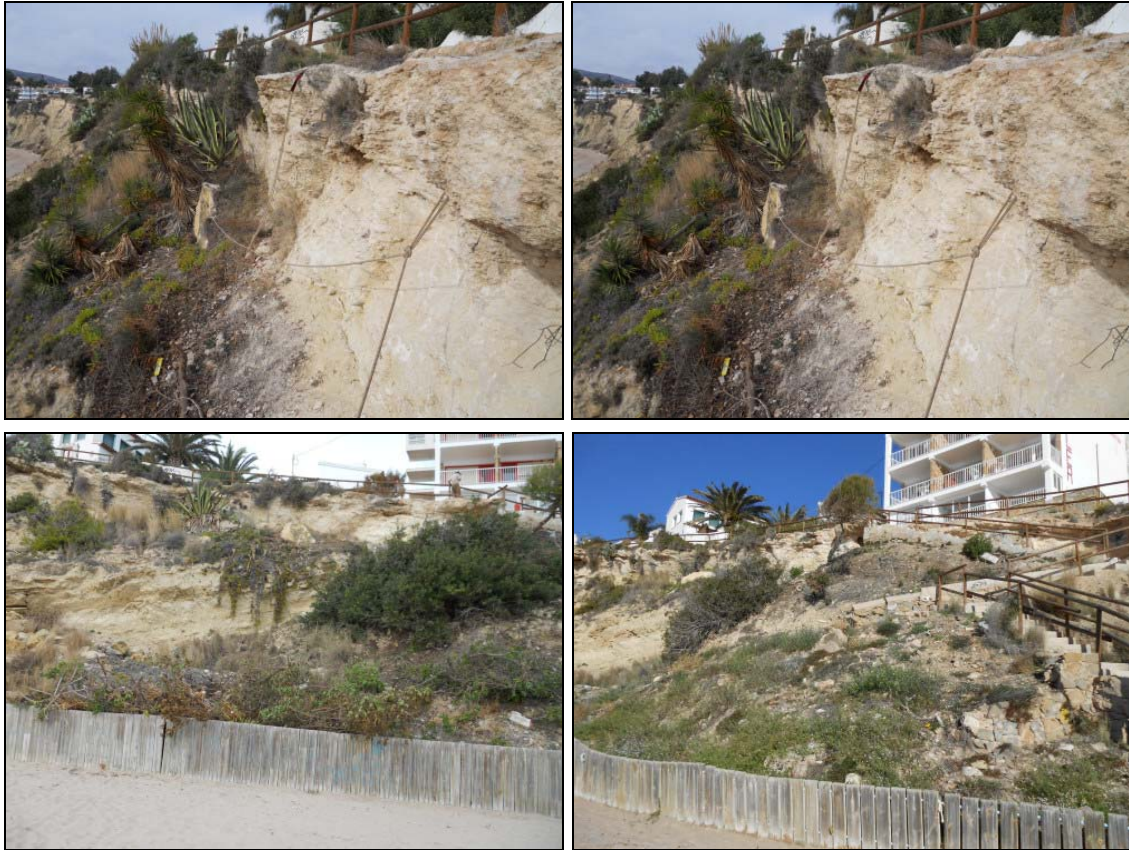
Figura 5. Zona B: Estado antes, izquierda (noviembre 2013) y después, derecha (febrero 2015).