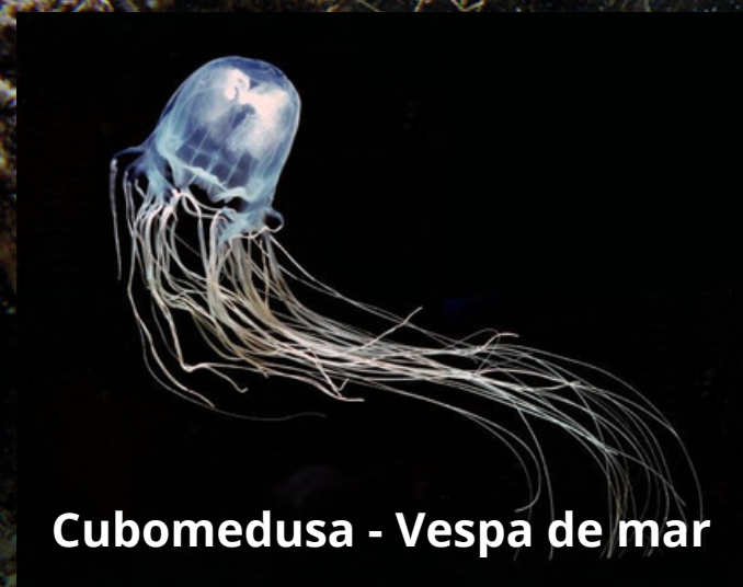
Cubomedusa - Vespa de mar