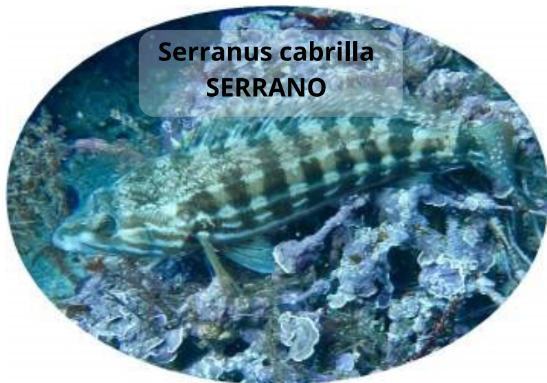
Serranus cabrilla SERRANO