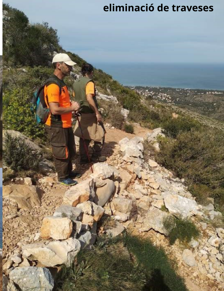
eliminació de traveses