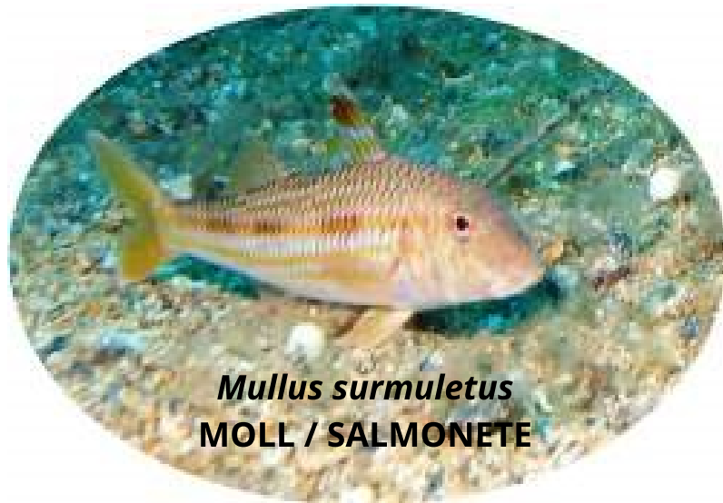
Mullus surmuletus MOLL / SALMONETE

A causa de la seva poca mobilitat la majoria han desenvolupat espines per protegir-se dels depredadors. En algunes espècies, les espines poden ser verinoses, com és el cas de la escorpa o de l'peix aranya.