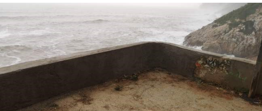
eliminació de grafitis