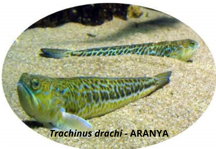
Trachinus drachi - ARANYA