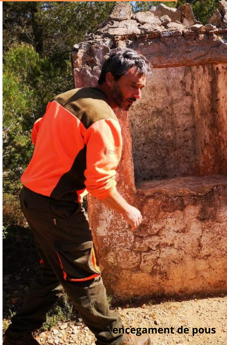
encegament de pous

L'equip de manteniment ha col·laborat amb l'Ajuntament de Xàbia en la reparació de la fuita d'aigua que havia deixat fora de servei els lavabos i les fonts de l'àrea recreativa del Cap de Sant Antoni. S'han encegat antics aljubs que s'han localitzat dins de muntanya pública, i que podrien suposar un perill si alguna persona o animal caiguera al seu interior. També s'han eliminat grafitis en alguns punts de parc que enlletgien aquestes zones.