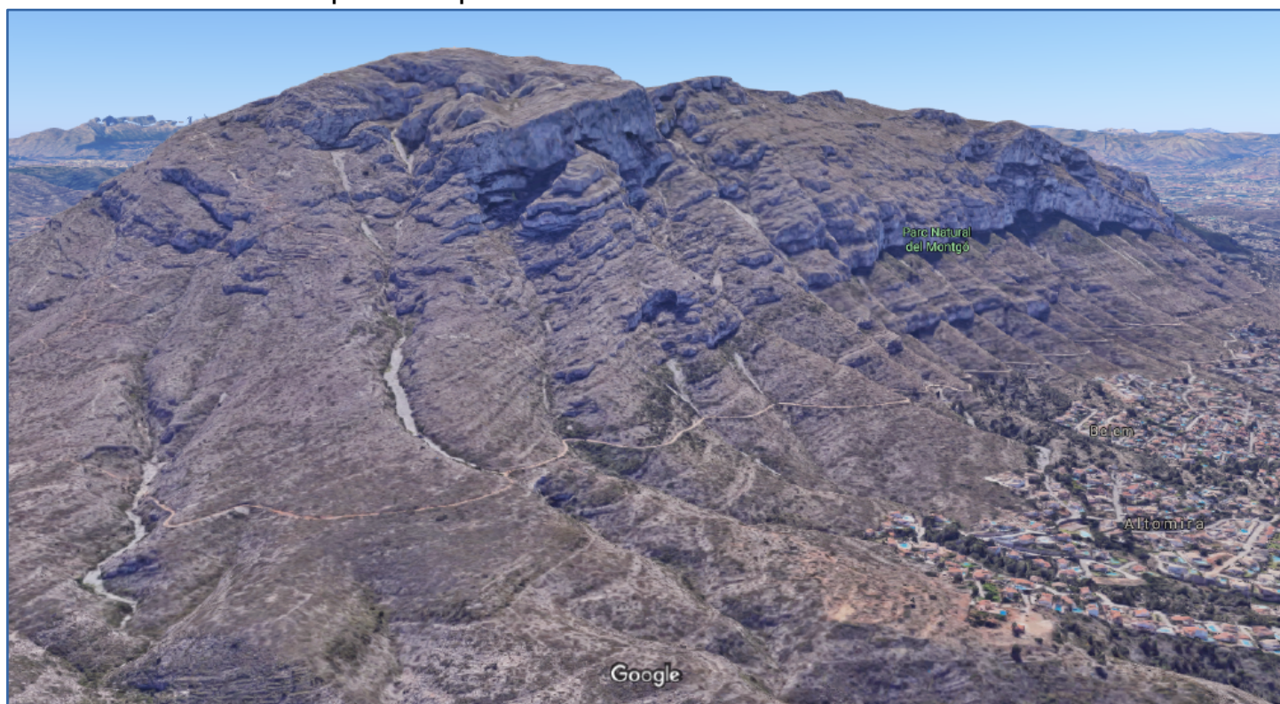
Imatge de Google Maps on s'observen els barrancs de la cara Nord i el Camí Colònies

En les tables i els mapes de les pàgines següents venen replegats els noms dels barrancs, començant de oest cap a est amb una numeració i una fletxa per tal de localitzar-los en el mapa en el punt on tallen el camí Colònies.