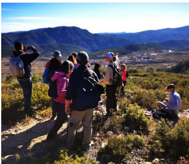
Asistentes a la actividad "al abrigo de las montañas" el pasado 12 de diciembre

Este 2019 quisimos celebrarlo realizando el itinerario de la cueva negra de Chera (ruta morada del Parque Natural) con la compañía de 20 participantes, Enchérate y la sociedad excursionista valenciana.