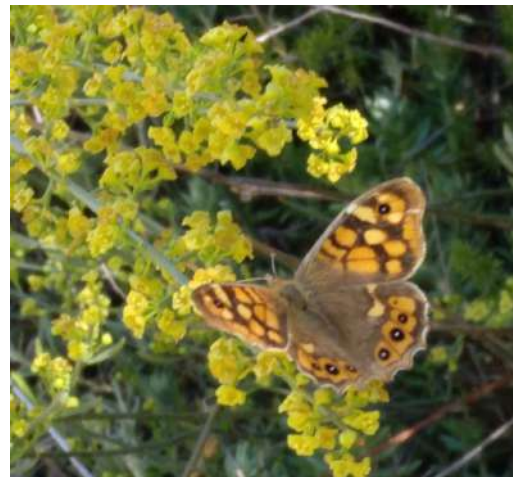
Una de la mariposas más comunes ( Pararge aegeria ) que podrás observar en el Oasis .

Esperamos que sea un recurso educativo y de disfrute para los habitantes de la zona y de todo aquel que lo visite.